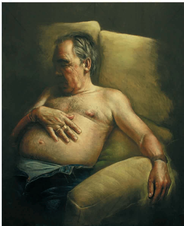
"16:30 pm". Pastel sobre tabla. 100 x 81 cm. Año 2008.