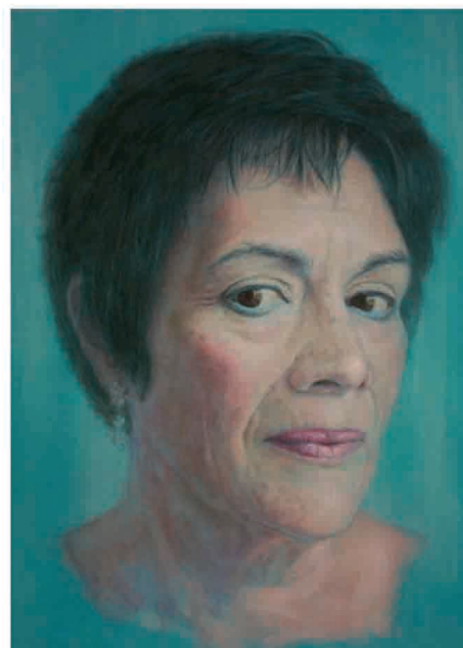
"Esperanza de los Ríos". Pastel sobre tabla. 150 x 110 cm. Año 2009.