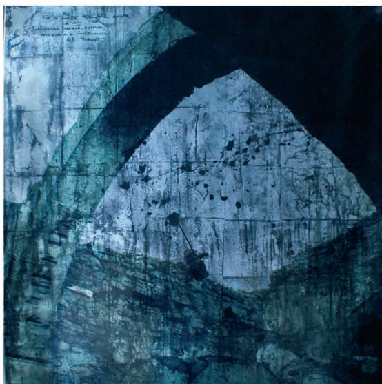
"Fundamento. (H. C. D. Friederich)". Técnica mixta sobre lienzo. (Acrílico, pan de plata, amonio sulfhidrato, impresión digital en vinilo). 100 x 100 cm.