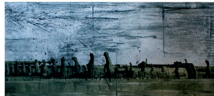
"Gárgolas". Técnica mixta sobre madera. (Acrílico, pan de plata, amonio sulfhidrato, impresión digital en vinilo). 132 x 59 cm.