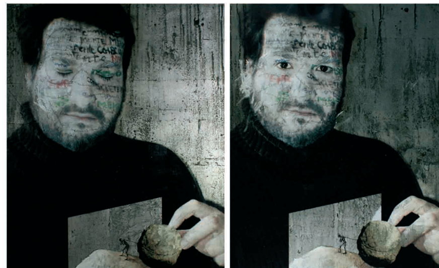
"Consciente-mente Inconsciente-mente." Díptico. Técnica mixta sobre madera. (Acrílico, pan de plata, amonio sulfhidrato, impresión digital en vinilo). 100 x 160 cm.