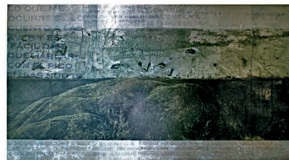
"Murmuros de extramuros". Técnica mixta sobre madera. (Acrílico, pan de plata, amonio sulfhidrato, impresión digital en vinilo). 55 x 87 cm.