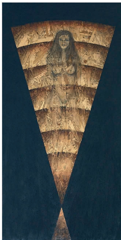
Circular XI; técnica mixta; 109 x 55 cm.