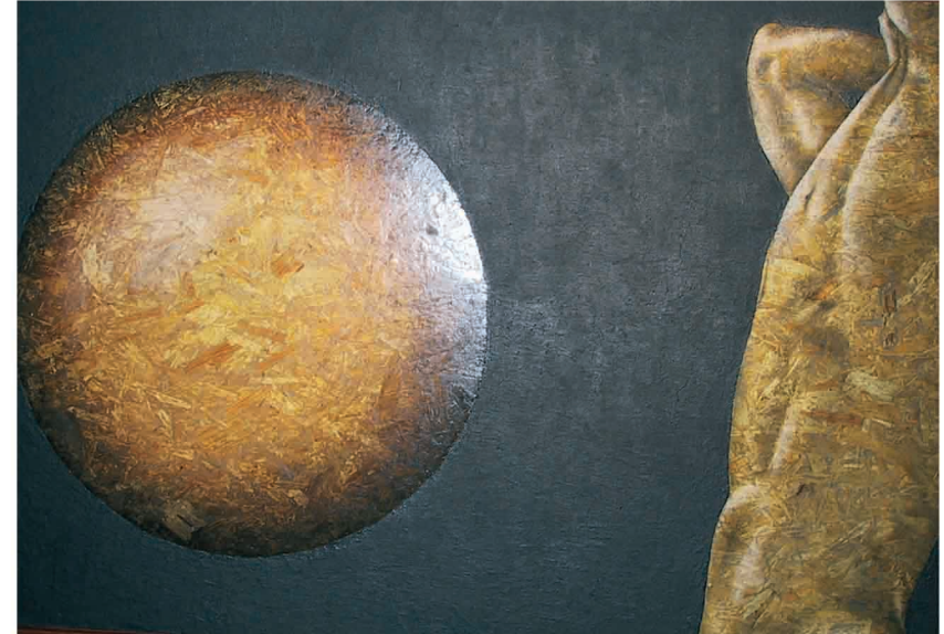
Circular XXII; técnica mixta; 150 x 100 cm.

Actualmente, los nuevos materiales utilizados, las nuevas técnicas aplicadas y un afán inagotable por el descubrimiento de lo bello, lo singular, lo sutil o lo agudo, siguen preconizando una larga vida a este autor.