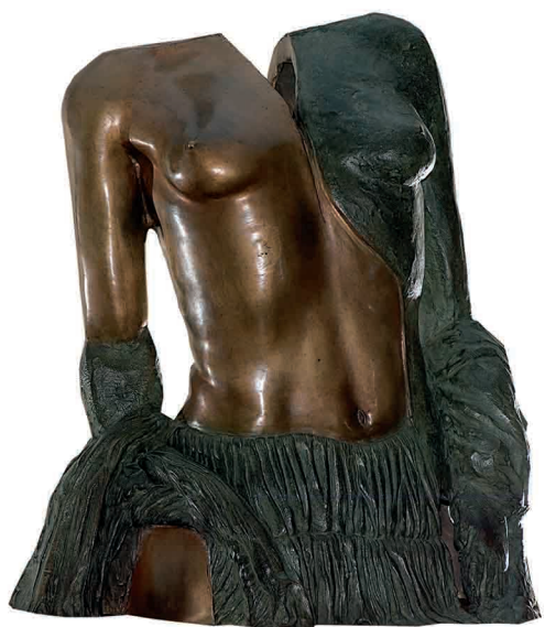
Desde el interior IV; bronce; 38 x 33 x 20 cm.