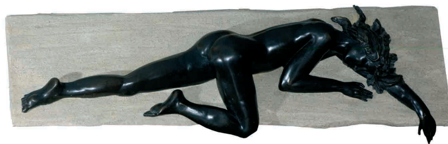
Dormida en el acantilado; bronce; 87 x 30 x 10 cm.