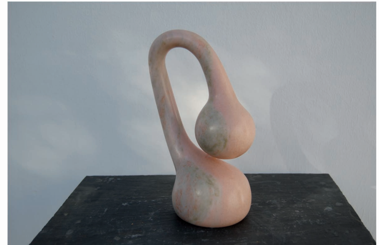
"H Altere - 7 - O elefante tem sede". Mármol. 25 x 14 x 10 cm.