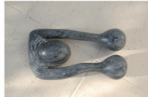
"H Altere- 10". Mármol. 44 x 23 x 11 cm.