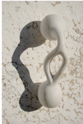
"H Altere- 5". Mármol. 53 x 25 x 14 cm.