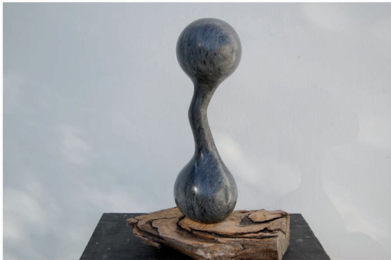
"H Altere - 8". Mármol. 40 x 37 x 18 cm.