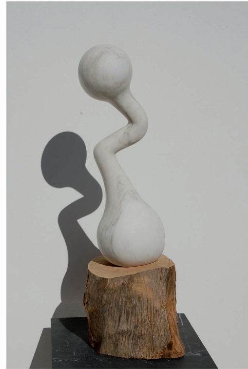
"H Altere-14- Engrenagem". Mármol. 77 x 23 x 20 cm.