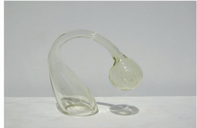
"Formas Trans 17". Esculturas en vidrio soplado. 26 x 10 x 10 cm.