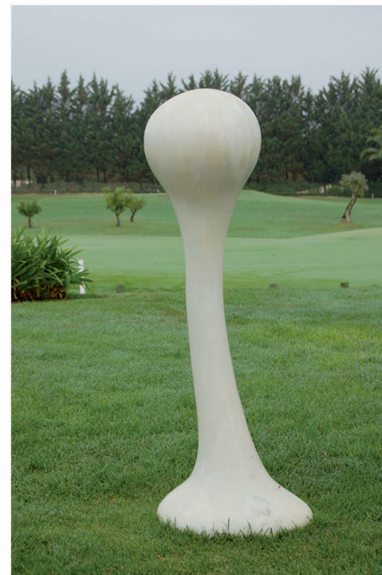
"H Altere - I". Mármore. 115 x 39 x 29 cm.