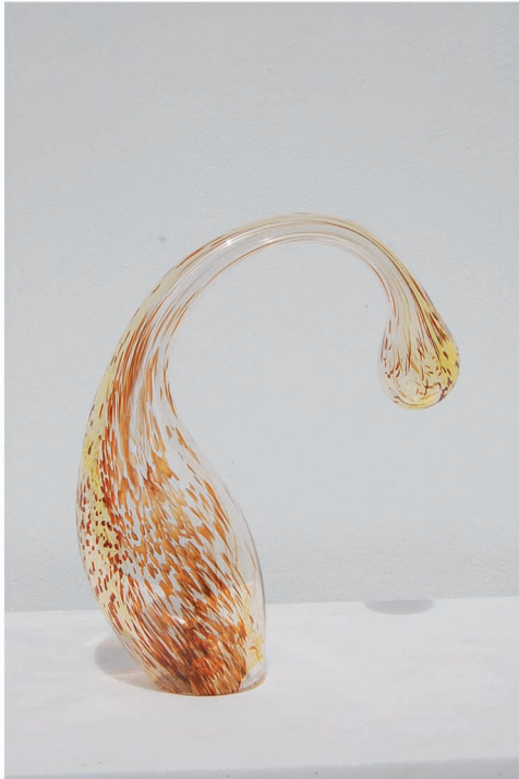
"Formas Trans 16". Escultura en vidrio soplado. 36 x 12 x 12cm.