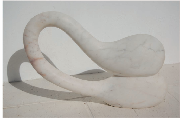
"H Altere - 2 - Sedução". Mármol. 60 x 14 x 41 cm.